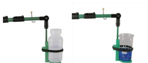
12.10.00.08* , Flex Bägarehållare exkl. bägare eller flaska

Det unika med UnoFlex systemet är enkelheten att byta verktygen som används till teleskopstängerna. Bilden ovan visar de olika stängerna med varierande längder, där vi lagerhåller de med markering *. Stängerna är av kraftig glasfiber men är inte för tunga samt enkla att förlänga inom sitt spann.