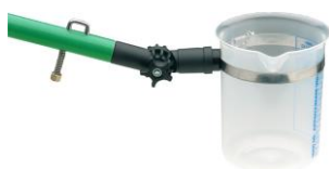
12.10.00.07* , Bägarehållare inkl. bägare 1000 ml

Snabbjustering med klämma för att spänna fast bägaren eller flaskan. Justerbar i höjddled.