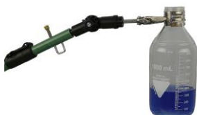
12.10.00.10* , Flaskhållare justerbar, inom intervallet 10-80 mm