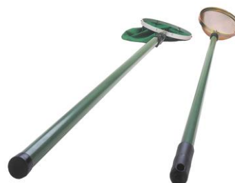
12.10.00.01* , UnoFlex teleskopstång 1,5-3,85 m 12.10.00.02* , UnoFlex teleskopstång 1,5-5,20 m