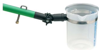
12.10.00.07*, Bägarehållare inkl. bägare 1000 ml

Snabbjustering med klämma för att spärra fast bägaren eller flaskan. Justerbar i höjdlid.