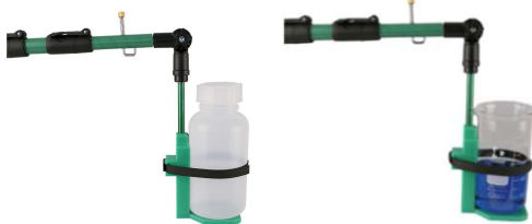
12.10.00.08*, Flex Bägarehållare exkl. bägare eller flaska

Det unika med UnoFlex systemet är enkelheten att byta verktygen som används till teleskopstängerna. Bilden ovan visar de olika stängerna med varierande längder, där vi lagerhåller de med markering *. Stängerna är av kraftig glasfiber men är inte för tunga samt enkla att förlänga inom sitt spann.