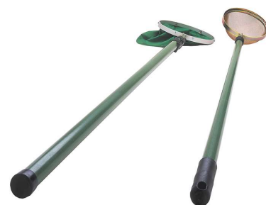
12.10.00.01*, UnoFlex teleskopstång 1,5-3,85 m 12.10.00.02*, UnoFlex teleskopstång 1,5-5,20 m 12.10.00.03* UnoFlex teleskopstång 1,5-5,20 m