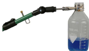
12.10.00.10*, Flaskhållare justerbar, inom intervallet 10-80 mm